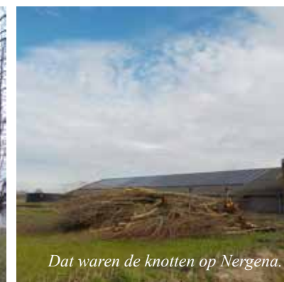
Dat waren de knotten op Nergena.