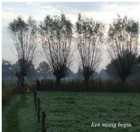
Een mistig begin.