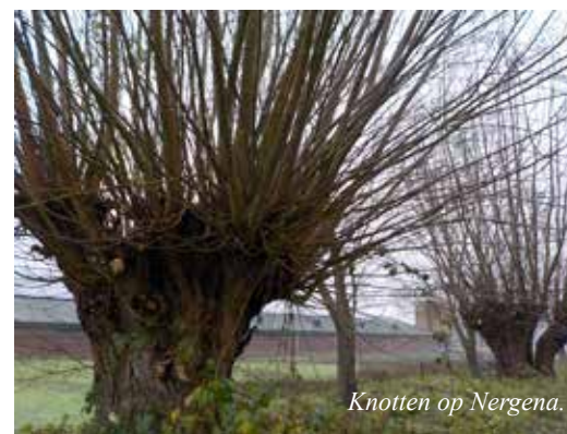
Knotten op Nergena.

Enkele keren werd ertwee keer op eenzelfde adres gewerkt, kleinere afwerkklussen bij elkaar geschoven als 'combi-klus' (=werken in kleine groepjes op 2 of 3 adressen). Extra data werden tussengevoegd, zelfs in de Kerstvakantie (28 dec en 4 januari). De Sparrenrijkgroep werd weer ingeschakeld als ultieme probleemoplosser (15 maart) en