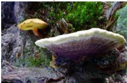
Dennevoetzwam met Houtboleet