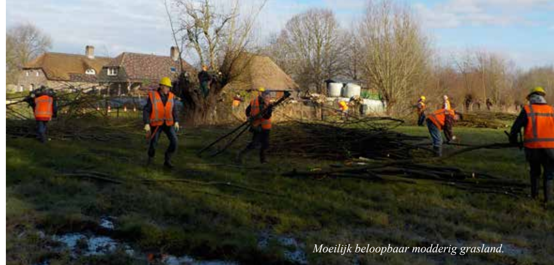
Moelijk beloopbaar modderig grasland.

De bomen bleken ook flexibel qua aantal en 'bewerkelijkheid', er was moeilijk beloopbaar modderig grasland, omheiningen vormden soms een probleem, gereedschap onwelwillend etc.