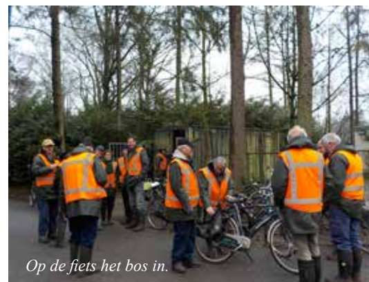
Op de fiets het bos in.